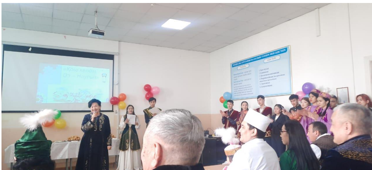
«Наурыз – бейбітшілік пен ізгілік мерекесі» іс-шарасы

Іс-шара барысында маңызды мәселелер анықталған жоқ. Дегенмен, мұндай шараларды ұйымдастыруды одан әрі жетілдіру үшін маркетингтік қолдауға және қатысушыларды көбірек тартуға көбірек көңіл бөлу қажет.